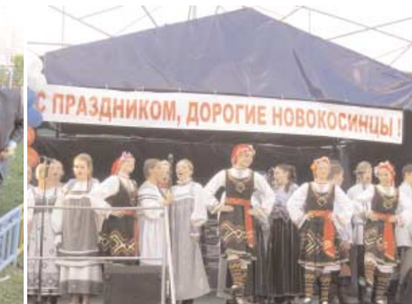
ение о сотрудничестве с... осино. Надеюсь, что наши... т такими же долговечны... евья, которые мы сегодня

уверен, в результате таких контактов жизнь людей будет интереснее, богаче и лучше везде – и в Москве, и в Мордовии, и в Волгограде, и в Болгарии. В ближайшее время собираемся построить «Московский дворик» в одном из городов-побратимов. Там, где наш дворик появится, люди, возможно, пожелают жить в луч-