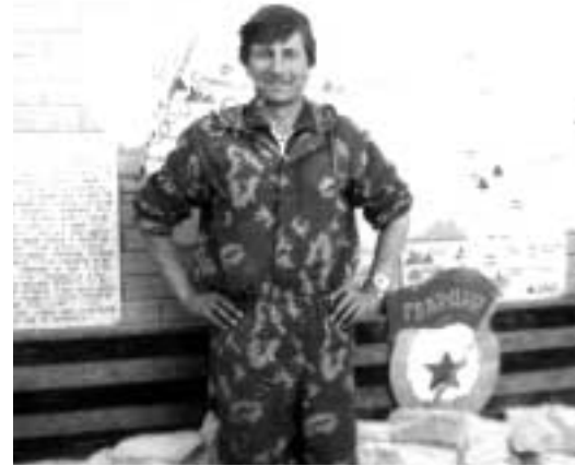
Уважаемые ветераны афганской войны!

Для общественных и ветеранских организаций главной задачей должна быть постоянная забота о сохранении памяти о подвигах и боевой службе каждого солдата, прошедшего Афганистан.