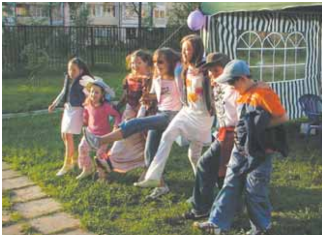
ТСЖ «Богатырь» – дружная семья

Для создания инициативных групп жителей управа района организует информационно-разъяснительную работу с собственниками помещений в многоквартирных домах о преимуществах ТСЖ, по вопросам, связанным с реализацией их прав и обязанностей в соответствии с Гражданским и Жилищным кодексами Российской Федерации.