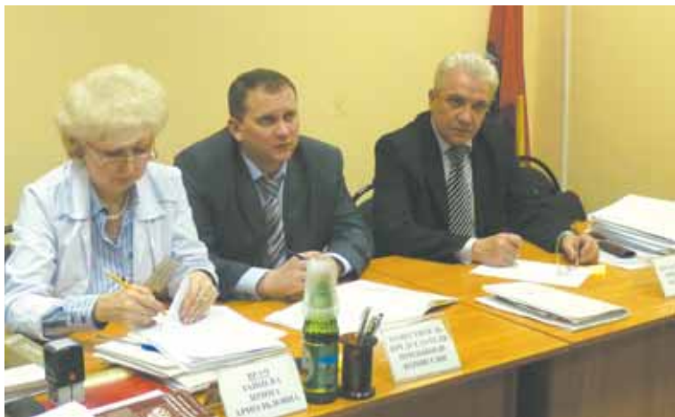
Заседание призывной комиссии района Новокосино