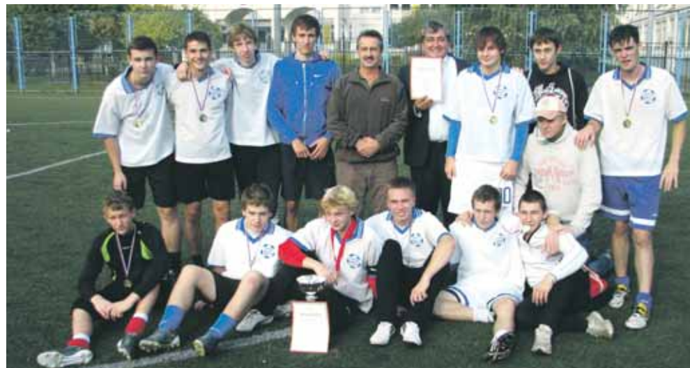
Чемпионы по футболу 2011 года. Команда ЦО №1925

23 сентября в финале окружных соревнований по флорболу, которые прошли в рамках спартакиады «Московский двор – спортивный двор» команда района Новокосино 1997-98 г.р. заняла II место. Поздравляем!