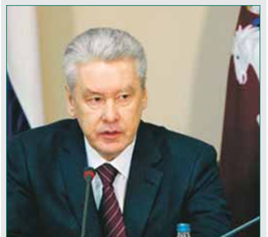
Мэр Москвы С.Собянин

13 октября в префектуре ВАО мэр Москвы Сергей Собянин провел выездное расширенное совещание с городскими и окружными руководителями, главной темой которого стала реализация Программы комплексного развития Восточного административного округа Москвы на 2011 год.