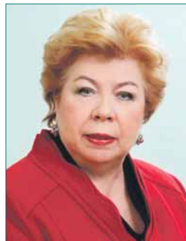
В 2012 году школа стала победителем городского конкурса «Лучшее предприятие для работающих мам».

Лучшие выпускники школы поступают в средние специальные учебные заведения и становятся профессиональными музыкантами. В 2012 году 15 учащихся поступили в средние специальные музыкальные учебные заведения, что составило 20% от общего количества выпускников 2012 года.