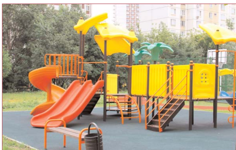
Территория школы №1200

площадки для игры в баскетбол и волейбол, беговая дорожка, для начальных классов и групп продленного дня сделана детская площадка с новым игровым комплексом. Также было полностью заменено асфальтовое покрытие, обустроен цветник и, что особен-