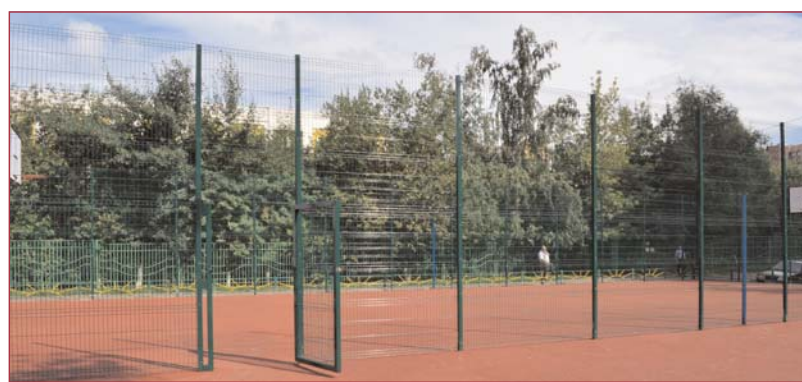
ул.Новокосинская, д.38 корп.2

Благодаря городской программе по развитию массового спорта и физической культуры, современную спортивную площадку уже невозможно представить без резинового покрытия и тренажеров WorkOut, которые пользуются у москвичей все большей популярностью – ведь для поддержания физической формы уже не надо тратить кругленькую сумму на абонемент в дорогой фитнес-клуб, а можно заниматься прямо во дворе в удобное время!