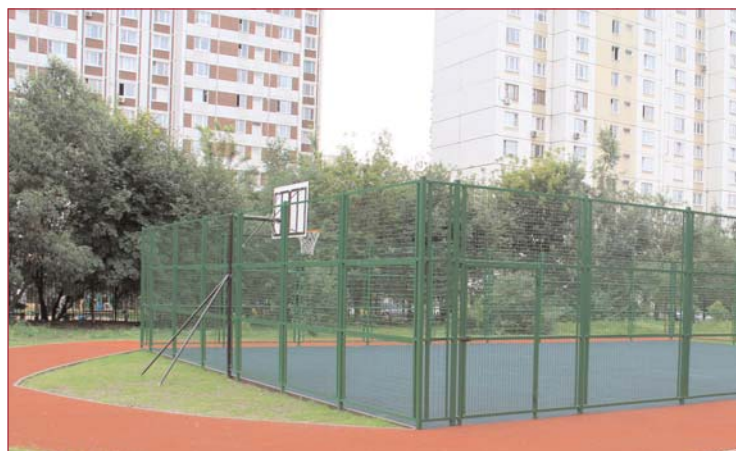
Территория школы №1200