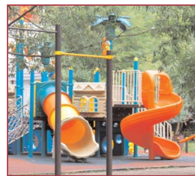
ул.Новокосинская, д.38 корп.2

На спортивной площадке по адресу: ул.Новокосинская, д.38 корп.2 – по просьбе жителей обо-