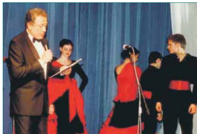
Бэлза Святослав Игоревич.