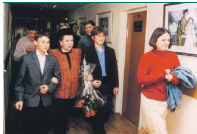
Г.П. Вишневская в колледже.