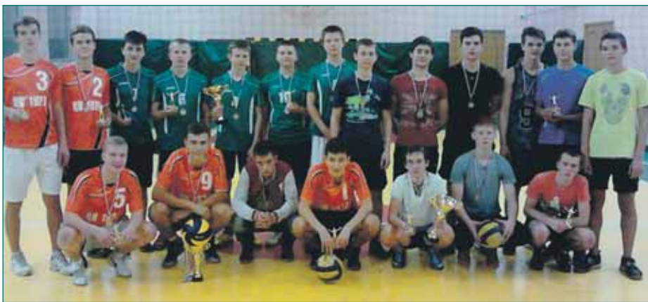
Финалисты первенства района по волейболу среди юношей.

В 2013 г. спортсмены района Новокосино заняли второе место в общекомандном зачете в окружных спартакиадах. В этом году появился реальный шанс улучшить этот результат.