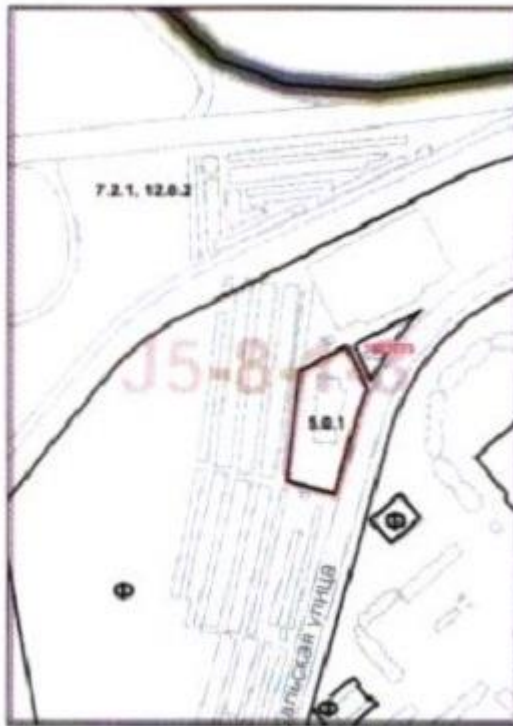
Схема границ проекта внесения изменений в правила землепользования и застройки города Москвы в части, касающейся территории муниципального округа Новокосино по адресу: ул. Суздальская, вл. 9А (кад. № 77:03:00090006:1017)

Приложение к решению Совета депутатов муниципального округа Новокосино от 13.12.2017 года № 7/1